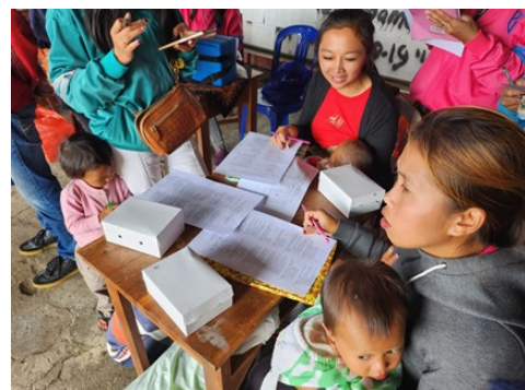
Gambar 3. Pelaksanaan posttest