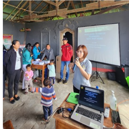
Gambar 1. Pemberian edukasi stunting