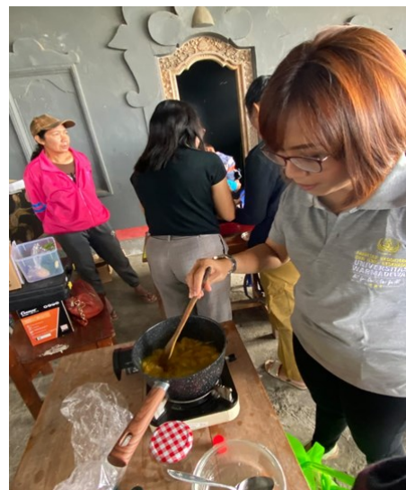
Gambar 2. Demonstrasi pembuatan MPASI