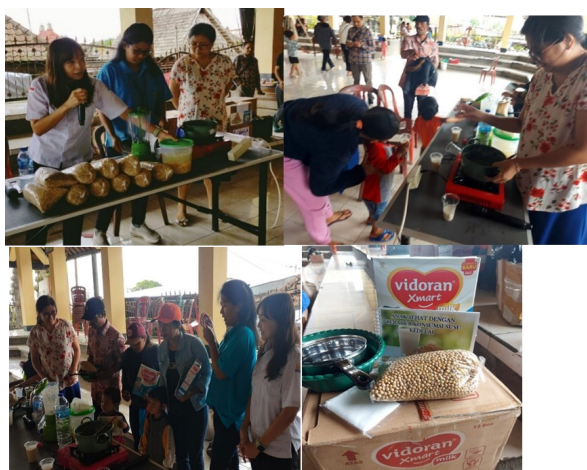
Gambar 3. Demo workshop pembuatan susu kedelai serta penataran pentingnya gizi seimbang bagi balita untuk mencegah stunting dan pembagian paket gizi berupa susu formula