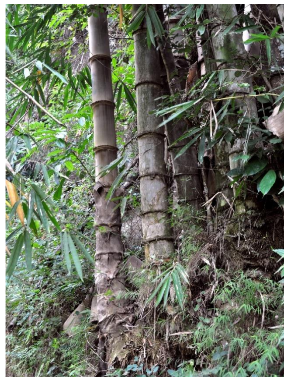
Gambar Bambu Petung